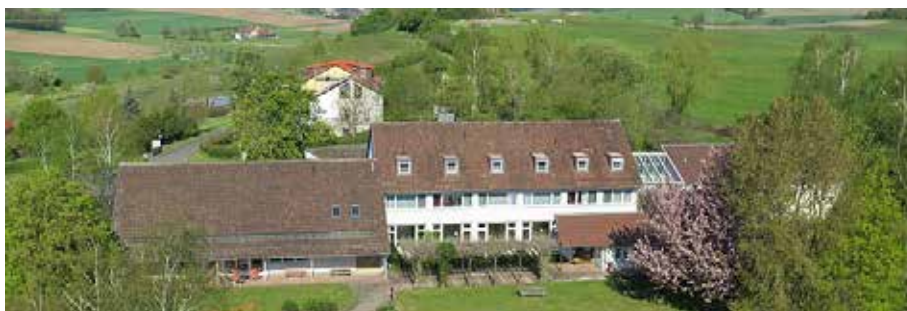
Blockhütte, großer Saal und Außenansicht Freizeithaus Burg Friede Burgambach