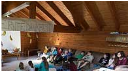
Blockhütte Haus Friede

Nutzen Sie die Chance, Gemeinde einmal anders zu erleben. Unter dem Motto „Wer bist denn du?“ planen wir im Haus Friede in Burgambach bei Scheinfeld ein buntes Freizeitprogramm, drinnen und draußen, für Jung und Alt. Los geht's am Freitag, 22. Mai um 18 Uhr mit dem Abendessen. Am Sonntag, 24. Mai geht es nach dem Mittagessen mit dem Reisesegen wieder nach Hause. Aufgrund des Stadtmarathons in Fürth feiern wir bereits am Samstagabend einen Familiengottesdienst. Für die Hin- und Rückfahrt bitten wir, Fahrgemeinschaften