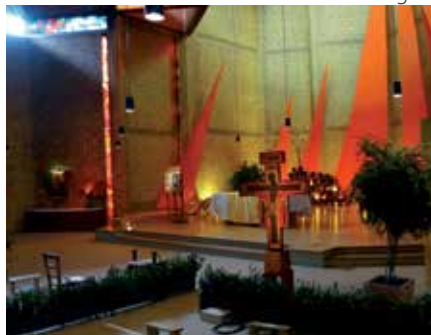
Taizé-Kirche von Innen

Herzliche Einladung zur Taizé – Reise nach Frankreich in der Bourgogne (Burgund). ( https://www.taize.fr/de ). Eine Woche lang werden wir mit den Brüdern von Taizé und Gästen aus aller Welt zusammen sein. Vor allem junge Menschen (100.000 pro Jahr) treffen sich dort, um gemeinsam den christlichen Glauben über alle Grenzen hinweg zu